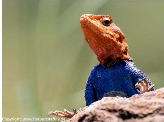
Das Männchen der Rotkopf-Felsenagame posierte für ein Portrait, für das ich auf dem Bauch lag.