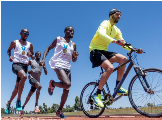
Olympiasieger Mo Farah (links) mit Hasen-Entourage auf der Bahn in Iten beim Intervalltraining