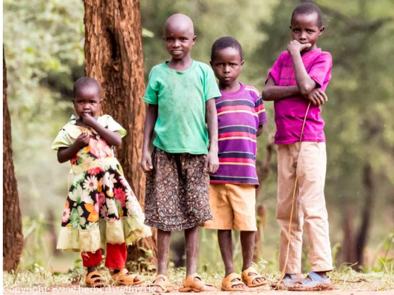
Erst große Skepsis vor dem weißen Mann...