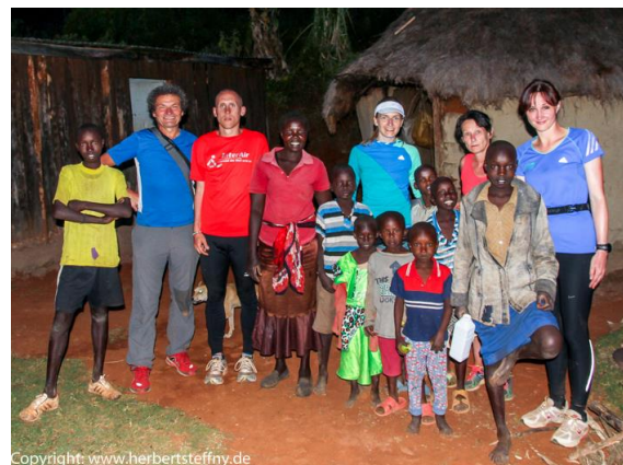
Nachdem Oli dieser Frau (Mitte) ihr Holzbündel ins Dorf trug, durften wir sogar in ihre Hütte.

Manche Methode führt auch bei zunächst schüchternen Kids zum Erfolg. Eine weniger fotografische Lösung wäre sich die Zuneigung durch kleine Geschenke zu „erkaufen“. Die Kids fliegen auf Bonbons, Gummibären, Bleistifte oder gar Kugelschreiber. Manchmal reißen sie sich regelrecht darum. Das Verfahren führt natürlich zu der oben genannten Situation, dass die Kinder erwarten für ein Foto auch „bezahlt“ zu werden. Eine vielleicht gefälligere und „foto-sportlichere“ Variante ist, das Interesse eben gerade durch das Fotografieren zu erwecken.