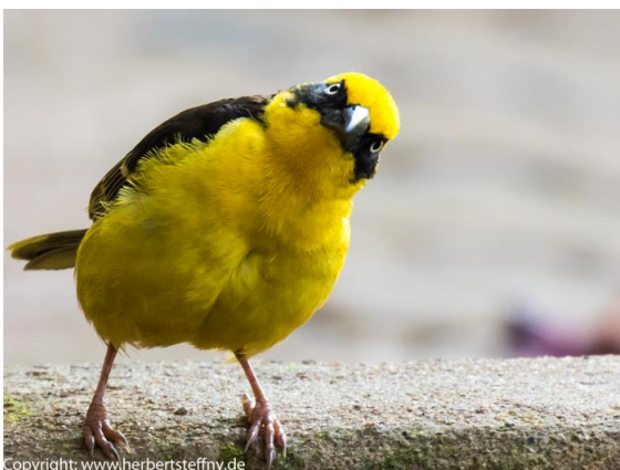
Was guckst Du? - Für dieses Webervogel-Portrait braucht man schon ein Teleobjektiv.

Im Nakuru Park verlassen wir soweit zugänglich an einem Aussichtsfelsen dem „Baboon-Cliff“ das Auto. Achten sie hier auf die ziemlich frechen Paviane. Diese Affen plündern nicht nur geschickt Ihre Snacks, sondern sind, v.a. wenn man den großen Alpha-Männchen provozierend zu nahekommt, nicht ungefährlich. Gegen Insektenstiche oder potentiell mögliche Bedrohung durch Schlangen, Skorpione und Genossen sollten Sie immer eine leichte, lange Hose anhaben und festes Schuhwerk tragen, Lauschuhe sind ok, Flip-Flops im Gelände ein absolutes No-Go!