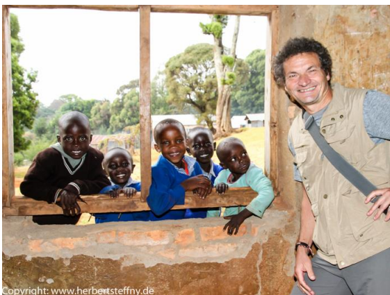
Ein Schulbesuch ist ein gute Gelegenheit Kinder ohne Scheu in ihrem gewohnten Umfeld zu fotografieren

Kinder auf dem Schulweg, mit der Viehherde, eine Kuh oder Schafe hütend sieht man immer wieder v.a. bei den Überlandfahrten (siehe eigenen Punkt). Mitlaufende Kinder hatten wir früher in Kenia überall. Mittlerweile haben sich die Kids aber an den laufenden Mzungu v.a. in der Nähe von Iten gewöhnt. Es ist also nicht mehr so besonders, wenn die Weißen vorbei joggen. Doch seien Sie immer darauf vorbereitet (mit der Kompakten oder dem Handy in der Hand), dass Ihnen beim Dauerlauf doch noch ein laut kichernder Schwarm von Jungs und Mädchen folgt. Manche nur ein paar Meter, die Talente dagegen begleiteten uns teilweise viele Kilometer.