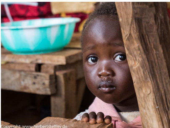
More Kids: eine schüchterne kleine „Rotznase“...

Nun kommt der lohnende, aber anstrengende Teil, denn jeder will fotografiert werden und sich danach betrachten. Das gibt einen Riesenspaß, alle werden natürlich Ihre Kamera anfassen (mit „Ugali-Fingern“, man isst hier die klassische Maispampe mit den Händen) und die Knirpse wollen eventuell sogar selbst Bilder machen. Nun müssen Sie auf Ihre Kamera aufpassen, weniger, dass sie geklaut würde, sondern eher, dass sie im Getümmel Schaden (Klappdisplay) nimmt und garantiert müssen sie diese hinterher putzen. Auf den Sinn einer Gegenlichtblende und eines UV-Filters als Schutz gegen Fingerabdrücke auf der Linse hatte ich bereits hingewiesen.