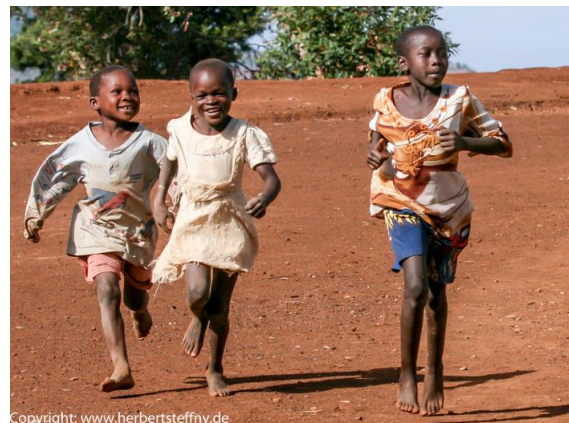
...und die kommenden Weltmeister beim Training.

Diese Methode ist mir gefälliger als Süßigkeiten, denn die Kids hatten schließlich einen spaßigen Nachmittag und ich hatte die Fotos auf dem Chip. Noch schöner ist es natürlich, wenn man bei Erlebnissen mit Menschen hinterher den Protagonisten ein Foto von sich geben kann. Mit Polaroidkameras ging das früher sofort. Aber es gibt heute auch die Möglichkeit einen mobilen Fotodrucker mitzunehmen. Mit einem