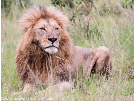
Der „König der Tiere“ ist ein Highlight jeder Safari, dem man aber besser nur im Fahrzeug begegnet.