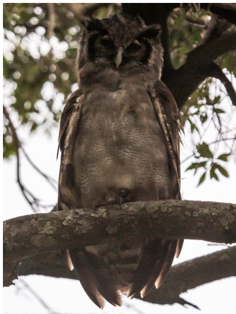
Eine große Eule ohne Blitz im Gegenlicht...

Bei den einfachen Kameras ist in der Regel ein Blitz eingebaut, der meist aber nur eine geringe Reichweite besitzt. Dieser kann auf kurze Entfernung als Aufhellblitz im mittäglichen gleißenden äquatorialen Sonnenlicht, aber auch bei schlechtem Licht oder in Innenräumen Verwendung finden. Da er direkt von der Kamera blitzt, hat man oft den unschönen „Rote-Augen-Effekt“, der mit einem Vorblitz oder auch danach oft Software-seitig behoben werden kann. Wer mehr Blitzleistung braucht, z.B. bei größerer Entfernung oder bei düsterem Umfeld, benötigt einen stärkeren externen Blitz, der auf dem Blitzschuh der Kamera oder auch seitlich versetzt ausgelöst wird. Gerade in der Wildlife-Fotografie hat man oft die Situation, dass man im Gegenlicht beispielsweise einen auf einem Ast sitzenden Affen oder Vogel gegen das helle Blätterdach oder den Himmel fotografiert. Ist die Entfernung nicht zu groß, kann hier der Blitz für Abhilfe sorgen, allerdings entspricht das dann nicht immer der natürlichen Lichtstimmung.