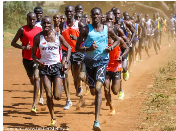
Ex-Marathon Weltrekordler Wilson Kipsang (der Große in der Mitte) lässt seine hintere Gruppe Staub fressen.