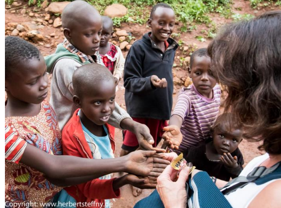
...doch bei Gummibären schmilzt diese dahin.

Die Vorgehensweise ist nun folgende: man fotografiert einen der Mutigen, was zunächst wieder Fluchtreaktionen auslöst, und versucht anschließend per Zeichensprache (die Kids dort sprechen kaum Englisch) sie wieder heranzulocken, um sich den komischen Apparat anzusehen. Sobald der erste auf dem Display sein Konterfei oder das eines Spielkameraden, wahrscheinlich zum ersten Mal im Leben, erblickt, ist der Bann gebrochen. Der Vorwitzige wird sich sofort halb totlachen und alle herbeirufen. Nun kommen auch die ganz kleinen und schüchternen Knirpse mit.