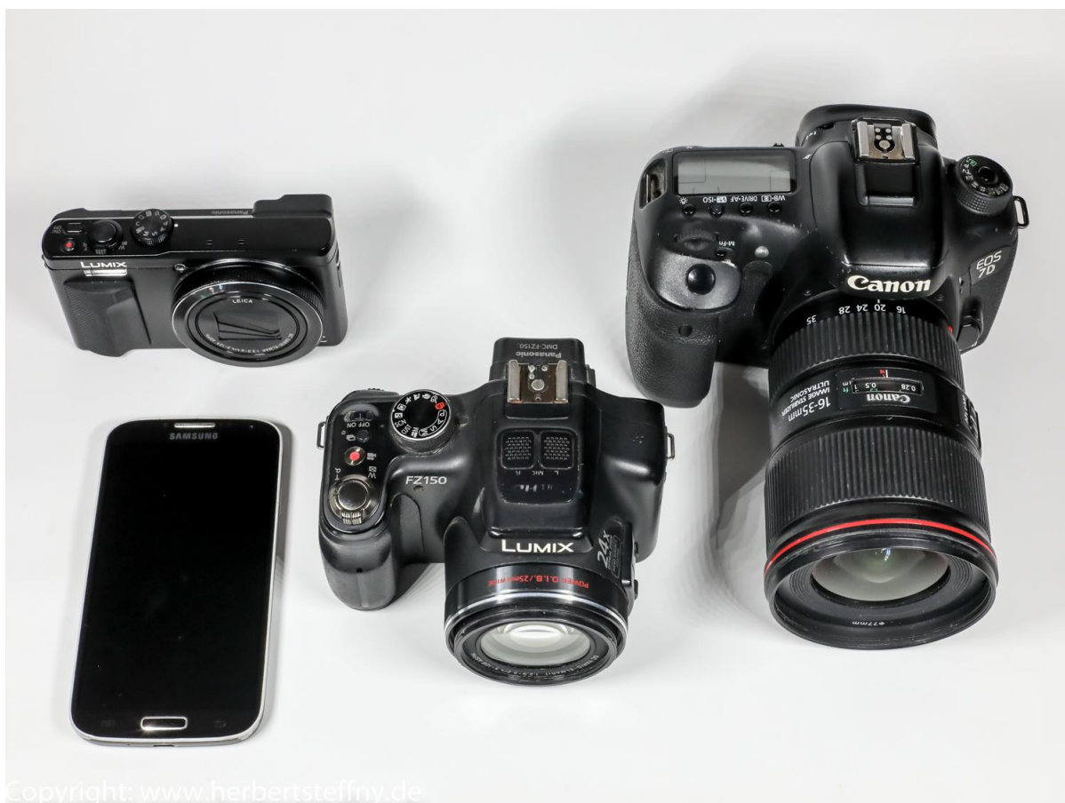
Kameratypen im Vergleich: links die Versionen für die Hosentasche: Handy und Panasonic TZ81, Mitte: eine Bridgekamera, rechts Spiegelreflexkamera, die schwerste, teuerste, meist, aber nicht immer die beste Lösung.

Nachteile des Smartphones sind das Display bei hellem Licht, bei dem man das Motiv oft schwer sehen bzw. beurteilen kann. Zudem fehlt eine Telefunktion, also Entfernteres größer abzulichten, etwa einen Vogel auf einem Ast. Auch für gelungenere Portraits sind sie weniger geeignet, da sie meist „weitwinklig“ arbeiten, verzerren sie die Perspektive, die Nase wird größer und möchten Sie einem Einheimischen das Ding direkt vor das Gesicht halten? Die ohne optischen Gewinn in Handys vorhandene digitale Ausschnittvergrößerung („Digital Zoom“, auch bei Kameras) oder Vorsatzlinsen mancher Smartphones sind keine echte Alternative. Da man sein Handy aber wohl immer parat hat, ist es als Erst- oder zusätzliche Zweitkamera natürlich nützlich und auf keine Kamera trifft der alte Spruch besser zu als auf das Mobiltelefon: „Die beste Kamera ist immer die, die man dabei hat!“ Stimmt!