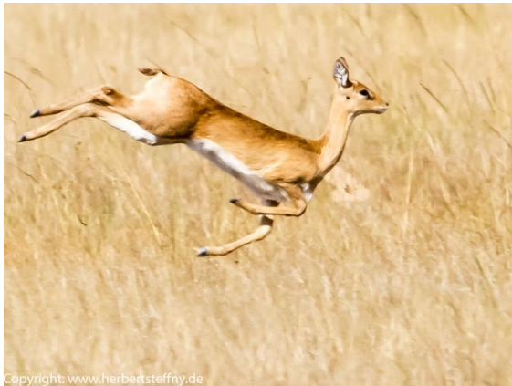
Eine übermütige Gazelle gut im Sprung erwischt. Aber die Schärfe des Bildes leidet unter dem nachmittäglichen Hitzeflimmern.

Beim Fotografieren ist das Morgen- und Abendlicht immer reizvoll. Sanfte Farben und weiches Licht. Aber diese Phase dauert am Äquator nicht lange. Anders als z.B. in Skandinavien, wo die Dämmerung stundenlang dauern kann, steht die Sonne hier ruckzuck über dem Horizont und die Kontraste werden sehr hart. Weg mit dem Fotoapparat? Bei einer Morgen-Safari, wenn die Sonne das Savannengras noch streichelt, haben Sie bestes Licht, aber mittags keine Tiere mehr fotografieren? In der Nähe mag man noch mit einem Blitz aufhellen können, aber bei vielen Fotos wird es nicht zu vermeiden sein, dass man nun harte Kontraste einfängt. So ist es halt, aber unschön. Der Profi fotografiert im flexibleren RAW-Format und hat am Computer mehr als bei JPG noch die Chance etwas auszugleichen. Je besser der Sensor in der Kamera, desto eher kommt er noch mit solchen Lichtverhältnissen klar.