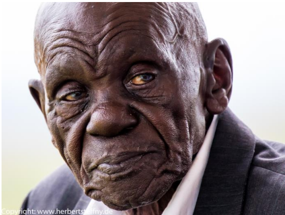
Portrait 1 – Die Falten des „Mze“, dem Ältesten der Gemeinschaft sprechen für sich.

Die erwachsenen Kenianer wird man meist auf dem Markt, Acker, beim Laufen oder in anderen Alltagssituationen antreffen und eventuell fotografieren. Auf dem Markt von Iten reagieren die Marktfrauen eher ablehnend, wenn man sie mit ihren Obst- und Gemüseständen und aufgetürmten Bohnensäcken ungefragt fotografiert. Besser ist es mit den Einheimischen erst mal ins Gespräch, besser noch ins Geschäft zu kommen, indem man ihnen etwas abkauft. Das kostet nicht viel und ändert die Ausgangssituation. Nun ist es leichter möglich ein Foto mit Marktfrau vor ihrem Stand zu bekommen. Natürlich fragt man auch jetzt höflichst um Erlaubnis. Richtig gute Portraits erfordern Vertrauen und viel Einfühlungsvermögen oder auch Glück.