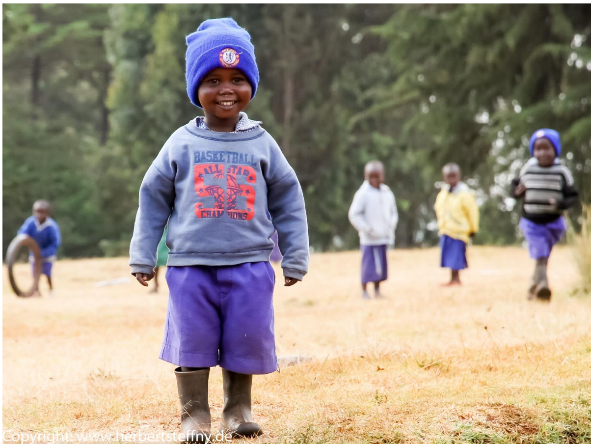
Den kleinen Goldzwerg hätten wir am liebsten eingepackt und mitgenommen. Kinder sollte man nicht von oben herab fotografieren. Aus tiefer Perspektive bekommen sie mehr Würde und Wirkung.

Die Kleinen sind ein beliebtes und oft sehr dankbares Fotomotiv. Manche der Kleinsten möchte man einfach nur Knuddeln, gleich einpacken und mit nachhause nehmen. Wie bei allen Fotos von Menschen sollte man auch bei den Kindern mit großem Respekt auftreten und die Einheimischen nicht wie Freiwild in einem Freilandzoo betrachten, die man mit dem Fotoapparat jagen darf. Nicht wenige Kids, v.a. wenn man weiter außerhalb von Iten unterwegs ist, haben zunächst Angst vor dem weißen Mann, dem „Mzungu“. Die Kolonialherren haben sich in Afrika eben nicht immer wie Gentleman benommen und so haben die Kleinen oft auch böse Geschichten zum Weißen Mann gehört. Umgekehrte Vorzeichen, denn bei uns heißt es im Kinderlied: „Wer hat Angst vorm schwarzen Mann?“ Interessanterweise geht es im Lied weiter: „...und wenn er kommt? Dann laufen wir!“ Vergessen Sie in Kenia das Weglaufen! Hier läuft der „Schwarze Mann“ viel schneller!