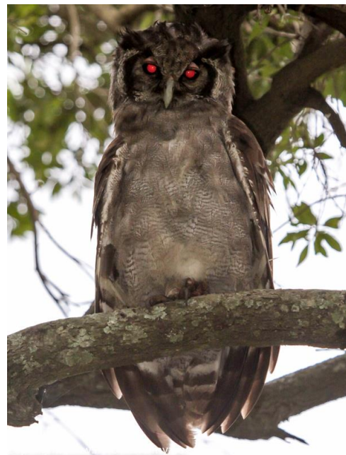
...aufgeblitzt, mehr Zeichnung und gespenstig!