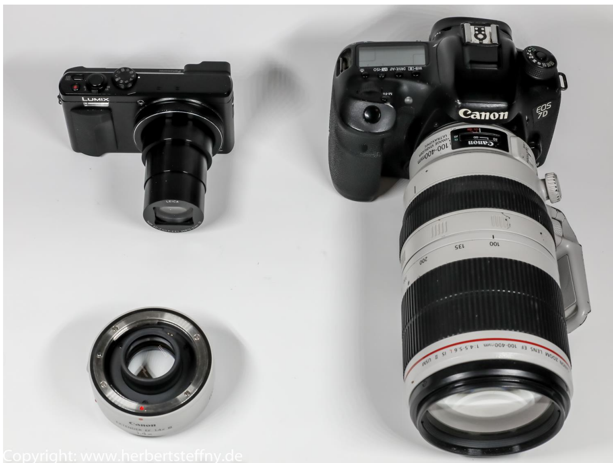
Links die sehr kompakte Traveller-Zoom-Kamera TZ81, die bei 282 Gramm mit ausgefahrenem Tele 720mm erreicht, rechts die „Profi-Lösung“ mit schwerem Canon EF 100-400mm IS II Tele, dazu links unten der dazu passende 1,4fach Telekonverter mit dem die Canon 7D II auf fast 900mm und 2,8 Kilogramm kommt.

Was wären Spiegelreflexkameras und Spiegellose ohne Wechselobjektive, bei denen man ebenfalls eine Menge Geld loswerden kann. Man unterscheidet sogenannte „Festbrennweiten“ mit einer festen Millimeterangabe wie Normalobjektiv 50mm, Weitwinkel 35 oder 24mm und leichtes Tele, z.B. 85mm bzw. starkes Tele im Bereich von 300 oder gar 600mm, die dann schon schwere Brummer darstellen. Die zweite Klasse sind die flexibleren „Zoom-Objektive“ mit einem dynamischen Bereich wie Weitwinkel-Zoom 16-35mm, Normalbereich-Zoom z.B. 15-85 oder 24-105mm und Tele-Zoom 70-200mm oder 100-400 oder -500mm. Festbrennweiten sind auf genau eine Brennweite berechnet und daher meist einen Tick schärfer, Zoomobjektive bieten dagegen mehr Flexibilität, denn nicht immer können Sie, selbst näher ans Motiv rücken oder nach hinten ausweichen, schon gar nicht bei einer Safari. Man muss beim Zoom auch weniger die Optik wechseln. Das ist wichtig, wenn es schnell gehen soll oder Staub in der Luft ist, der ins Gehäuse eindringen kann.